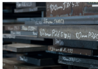
Über 1.000 to Stahl und Edelstahl ständig am Lager