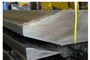
Anbringen von Fasen, körnern und signieren