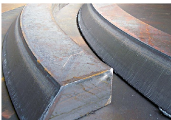
Materialstärken bis 300 mm